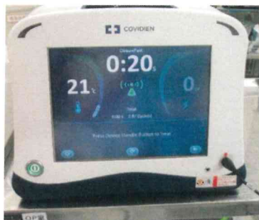
カテーテルと血管内治療装置 120°Cの熱を血管壁に加えて血管を焼灼します