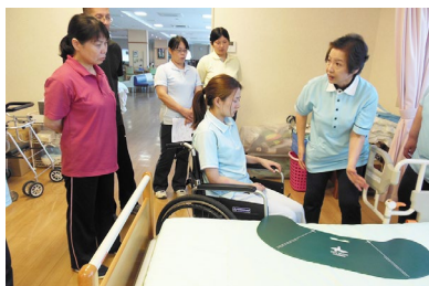
① 介護演習 福祉用具を使用した移乗介助