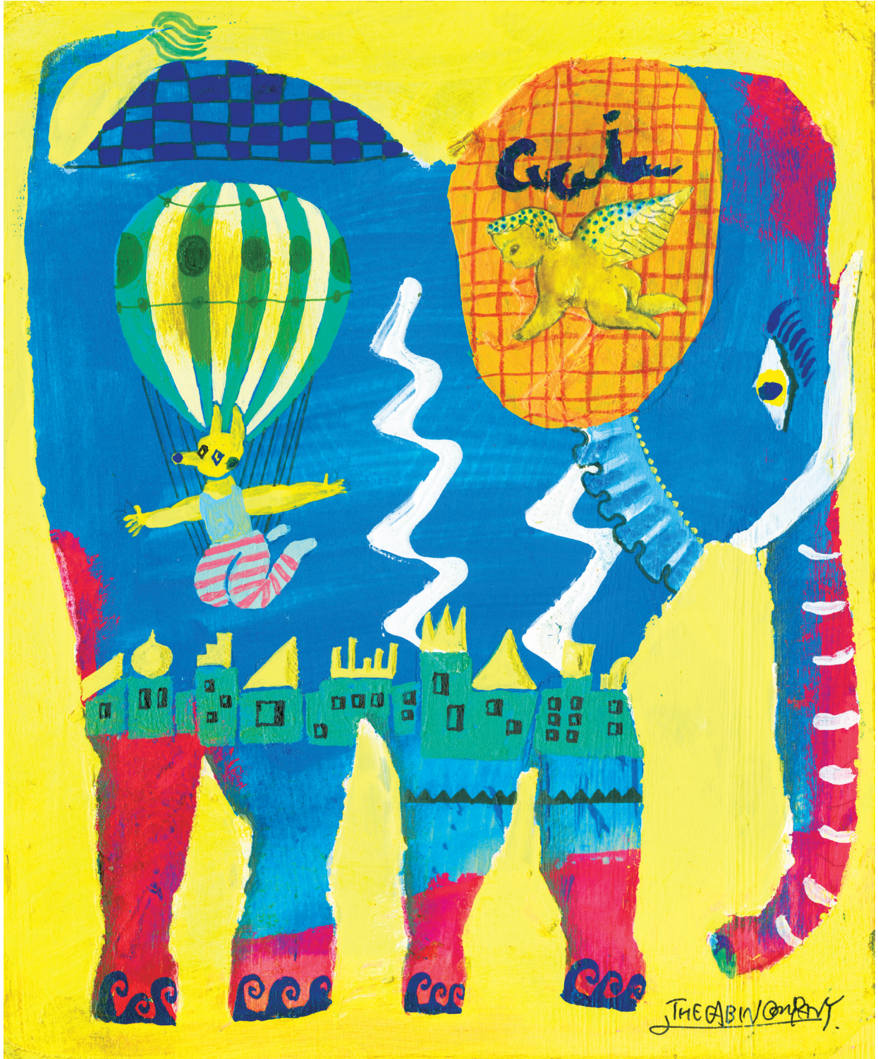
絵/ザ・キャビンカンパニー