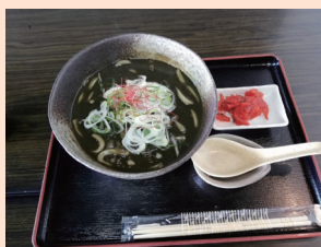
山椒カレーうどん

の深さを感じます。イカ墨で仕上げたスープと白い麺、そしてネギの青さが冴えています。