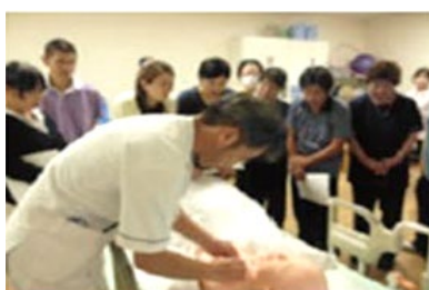
② 医療的ケア演習 喀痰吸引