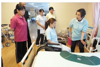
① 介護演習 福祉用具を使用した移乗介助