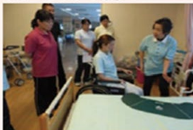
①介護演習 福祉用具を使用した移乗介助