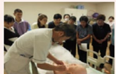
②医療的ケア演習 喀痰吸引