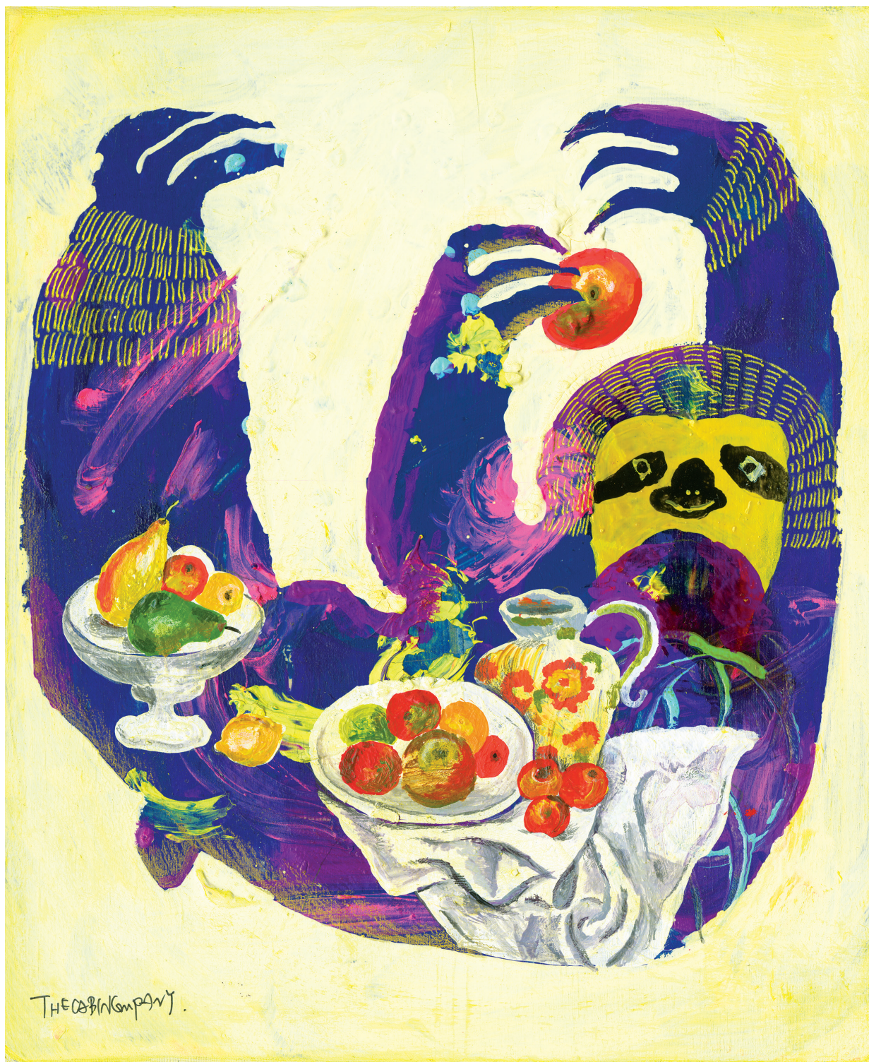
絵／ザ・キャビンカンパニー