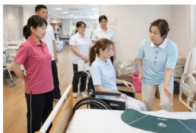
① 介護演習 福祉用具を使用した移乗介助