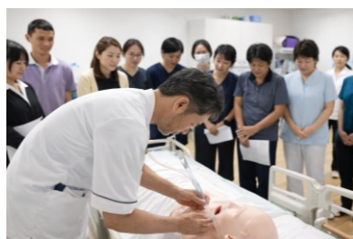
② 医療的ケア演習 喀痰吸引