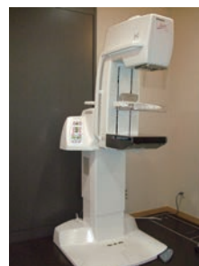
マンモグラフィー